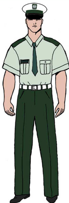
Ubiór uprawnionego w koszuli służbowej z krótkim rękawem – dla mężczyzny 4)