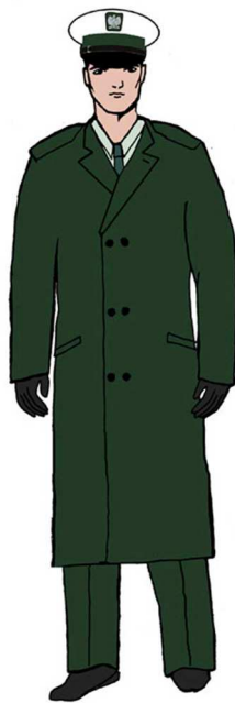
Ubiór Głównego Inspektora Transportu Drogowego (jego zastępcy) oraz wojewódzkiego inspektora transportu drogowego (jego zastępcy) w płaszczu