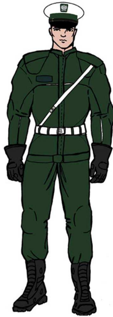
Ubiór uprawnionego – motocyklisty 5)