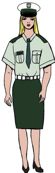
Ubiór uprawnionego w koszuli służbowej z krótkim rękawem – dla kobiety 3)