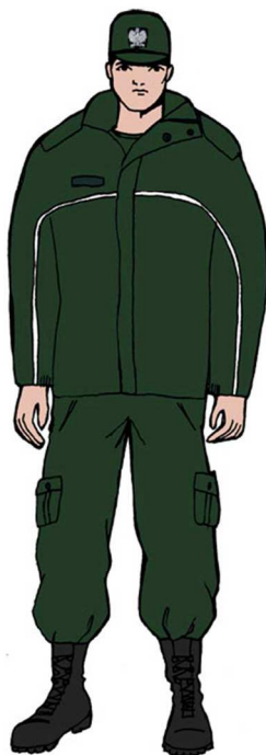
Ubiór uprawnionego w kurtce 3 / 4