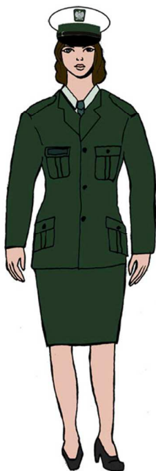
Ubiór uprawnionego w marynarce gabardynowej – dla kobiety 2)