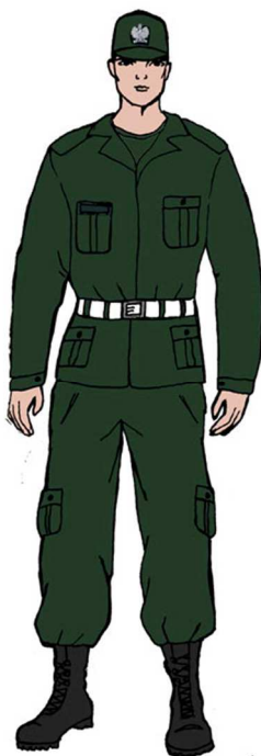
Ubiór uprawnionego w bluzy polowej 6)