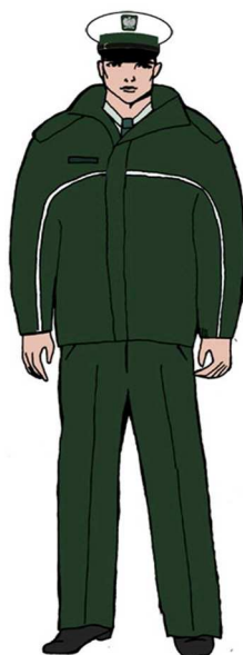
Ubiór uprawnionego w kurtce \frac{3}{4} – dla mężczyzny