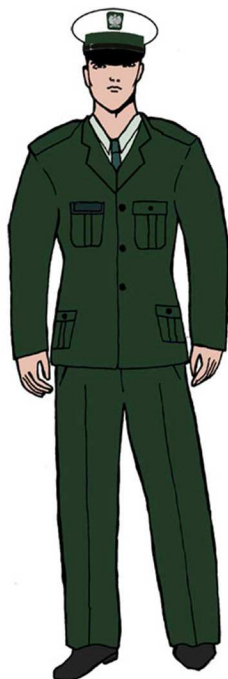
Ubiór uprawnionego w marynarce gabardynowej – dla mężczyzny