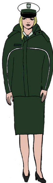
Ubiór uprawnionego w kurtce \frac{3}{4} – dla kobiety 1)