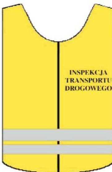
kamizelka ostrzegawcza – przód